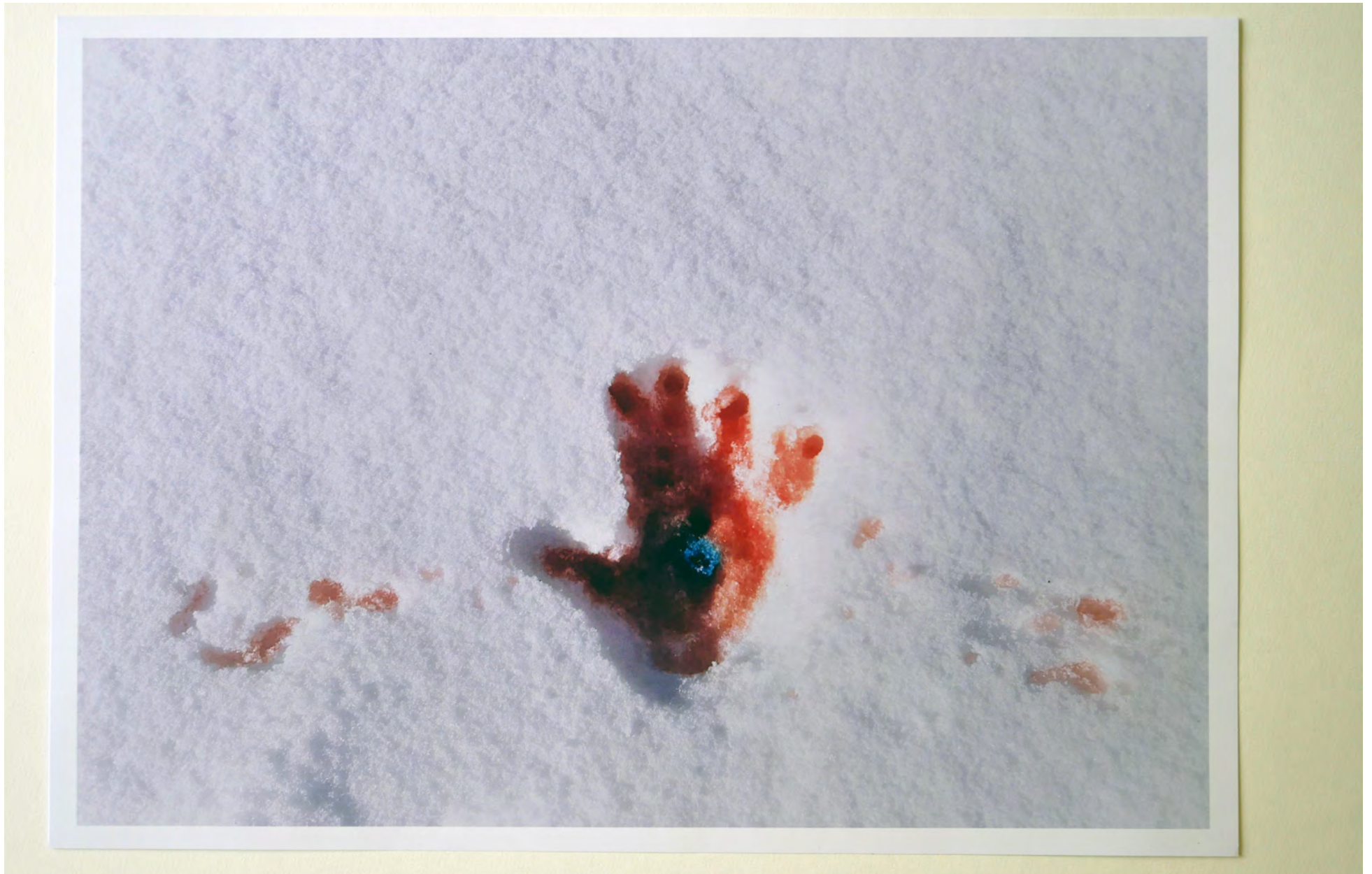
1 Rote Hand im Schnee Fotografie, Arthur Albrecht (Kl. 5/3)