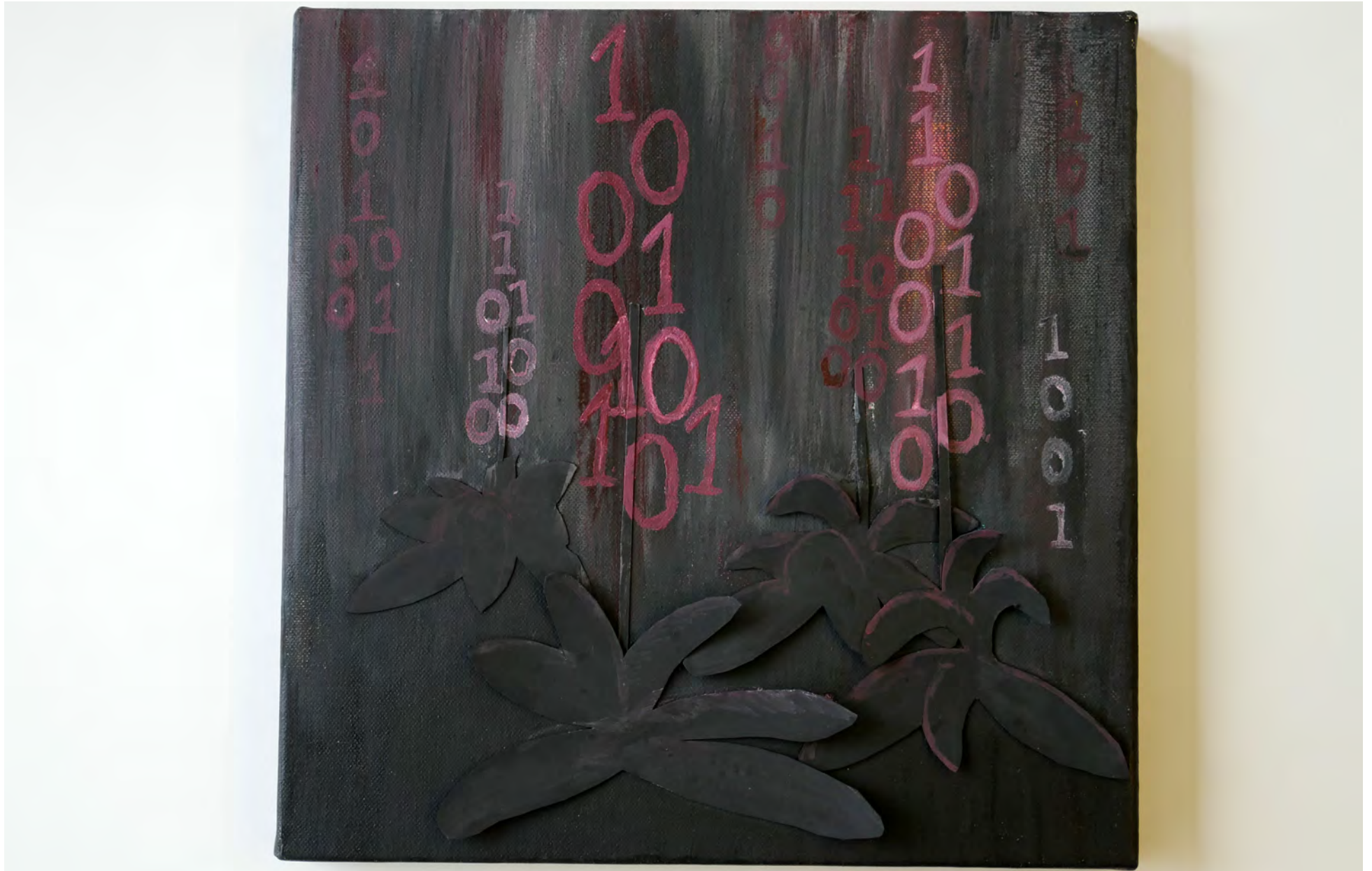
3 Digitales Purpurea Malerei, Collage auf Leinwand, Siri Illgen (Kl. 5/4)