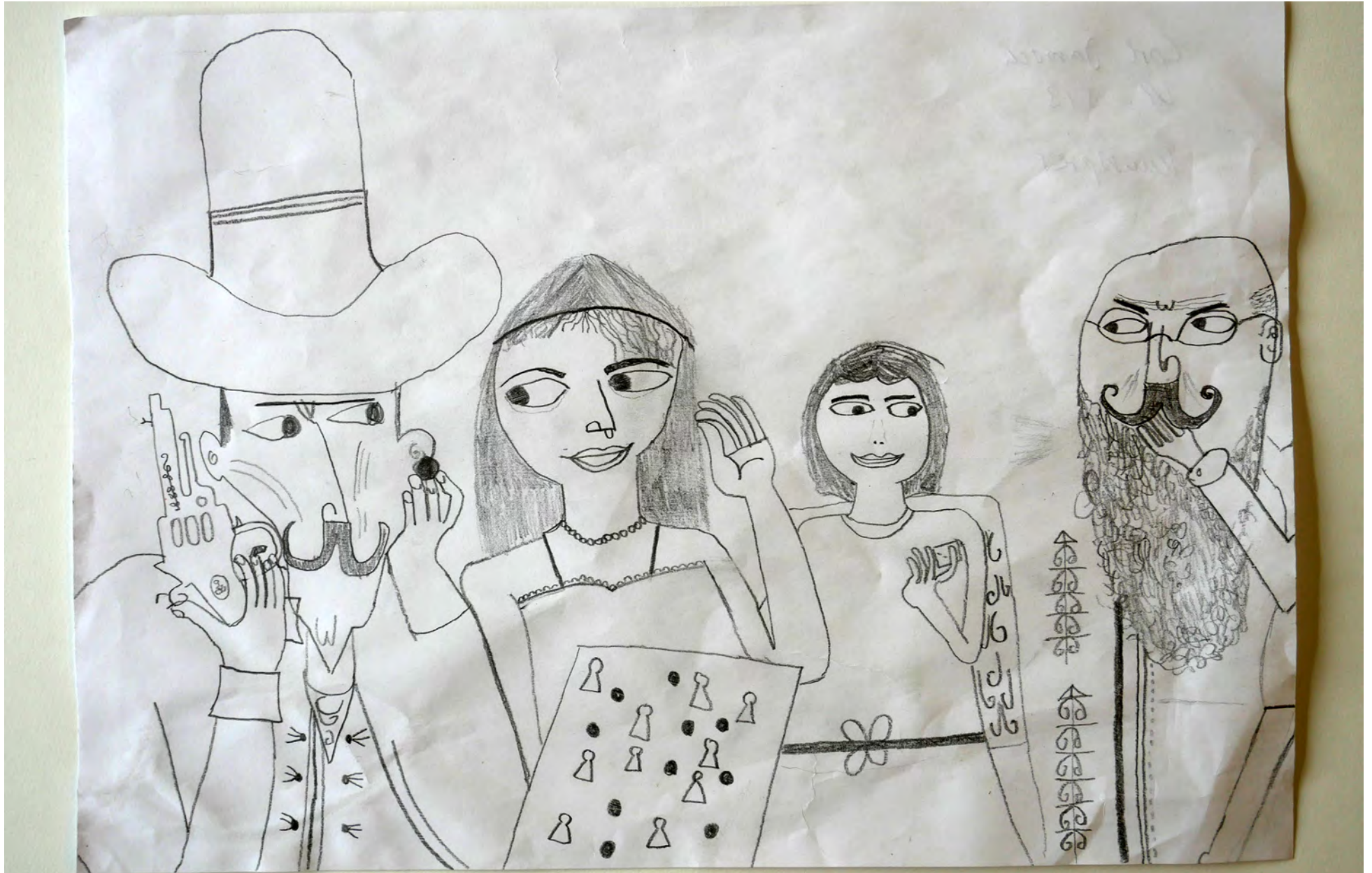
2 Malefiz-Bild Bleistift-Zeichnung, Carl Jarosch (Kl. 5/3)